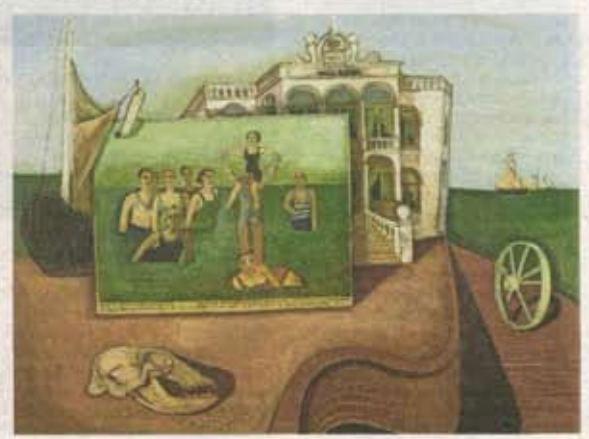
Herinnering aan Norderney (1929)