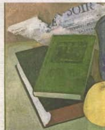
Stilleven met grapefruit (1940)