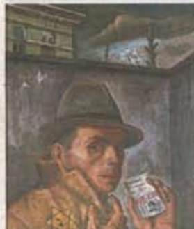
Zelfportret met jodenpas (omstreeks 1943)

opening van de tentoonstelling in Haarlem onder de indruk te zijn van de werken die hij vlak na zijn aantreden tijdens een bezoek aan het museum, ontworpen door de Amerikaanse architect Daniel Libeskind, in Duitsland mocht aanschouwen. 'Museum zonder uitgang' noemde Libeskind zijn creatie, waarin Felix Nussbaums werken een nog aangrijpend effect op de kijker krijgen. Ook de biografie over de kunstenaar liet Wienen naar eigen zeggen niet onberoerd.