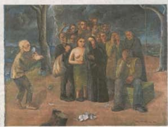
De storm (1941)